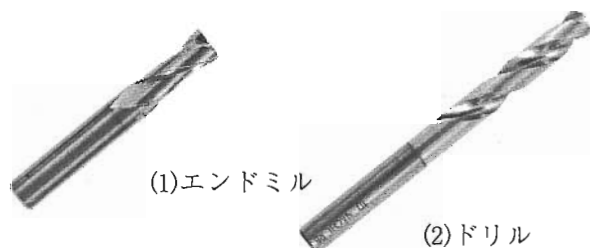
図 1 外観

【構成】高速度鋼，超硬合金，サーメット，セラミックのいずれかを母材質とし，表面被覆膜が原子パーセントで Ti を 60～100% 含み，Ti 以外の金属構成金属が Zr, Hf, Nb, Ta, B, Ae, Si の 1 種または 2 種以上の成分とし，600℃以下の温度にて炭素，窒素，酸素のうちいずれか 1 種または 2 種以上の化合物の反応ガス成分中で物理蒸着法により母材表面に複数コーティングする。この際，コーティング膜の最上層の表面から 0.2～2.0 \mu\text{m} の範囲の膜の成分を \text{Ti}_x\text{Ny} とする。またコーティング膜のうち，切削に