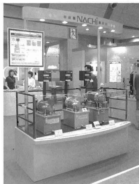
図5 ナチッコIIのデモンストレーション（比較実演）