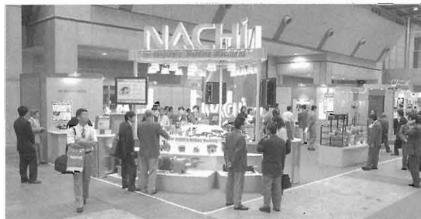
図1 ナチブース全景

操作して頂けるようにするとともに、アテンド員もより詳しい説明ができるように工夫した。