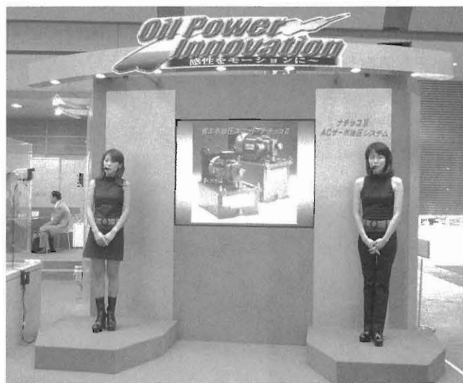
図3 ナレータによる省エネ油圧機器の説明

デモンストレーションでは、従来汎用タイプの油圧ユニット、従来のナチッコ、新規開発のナチッコIIの3台のユニットを並べて展示し、同一の条件でサイクル運転を行い、各々消費電力、タンク油温をリアルタイムで表示して、ナチッコIIの優れた省エネ性能をアピールした。また、ナレータによる説明では、インバータを使用していないにもかかわらず、インバータを使用したユニットよりも優れた省エネ性能を有すること、及びナチッコIIのシンプルな構成は、信頼性が高くメンテナンスもしやすいことをアピールした。