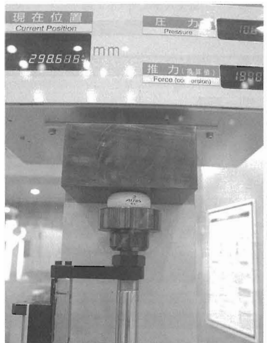
図9 ゴルフボールが変形した様子