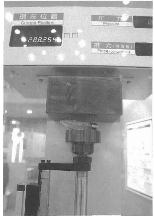
図8 電球をつかむ様子