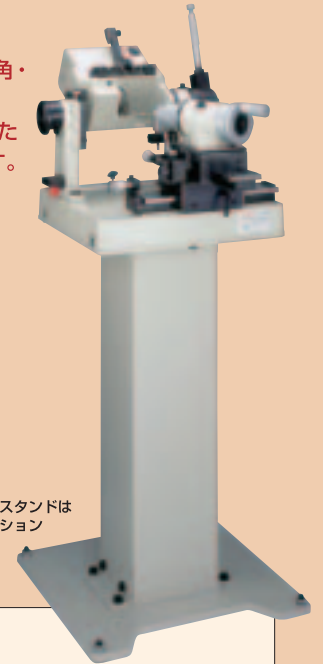
専用スタンドはオプション